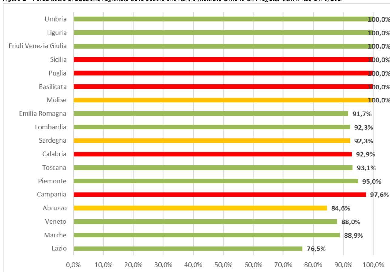
Figura 2 - Percentuale di adesione regionale delle Scuole che hanno inoltrato almeno un Progetto dell'Avviso 1479/2017

Nella Figura 2 si osserva che l'adesione delle scuole è stata molto alta e variegata. Il Lazio e l'Umbria, insieme alla Liguria e al Friuli Venezia Giulia, pur appartenendo alla stessa area territoriale (il colore verde identifica l'area territoriale più sviluppata) presentano un comportamento opposto: il Lazio con la più bassa percentuale di adesione e le altre con una percentuale massima.