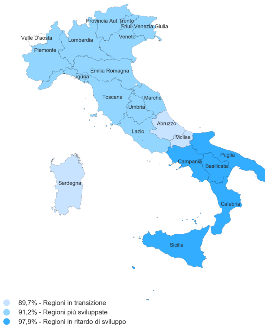
Figura 1 - Distribuzione della percentuale di adesione per aree territoriali

* Si ricorda che le Province Autonome di Trento e Bolzano e la Regione Valle d'Aosta sono escluse dall'Avviso